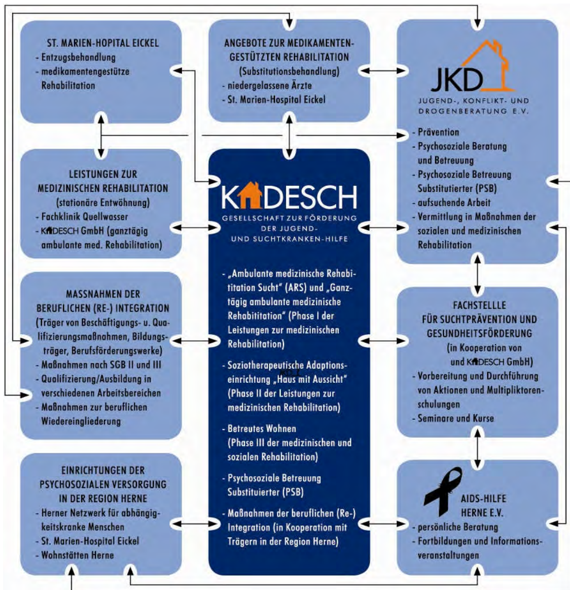
Schaubild: Drogenhilfesystem Herne“