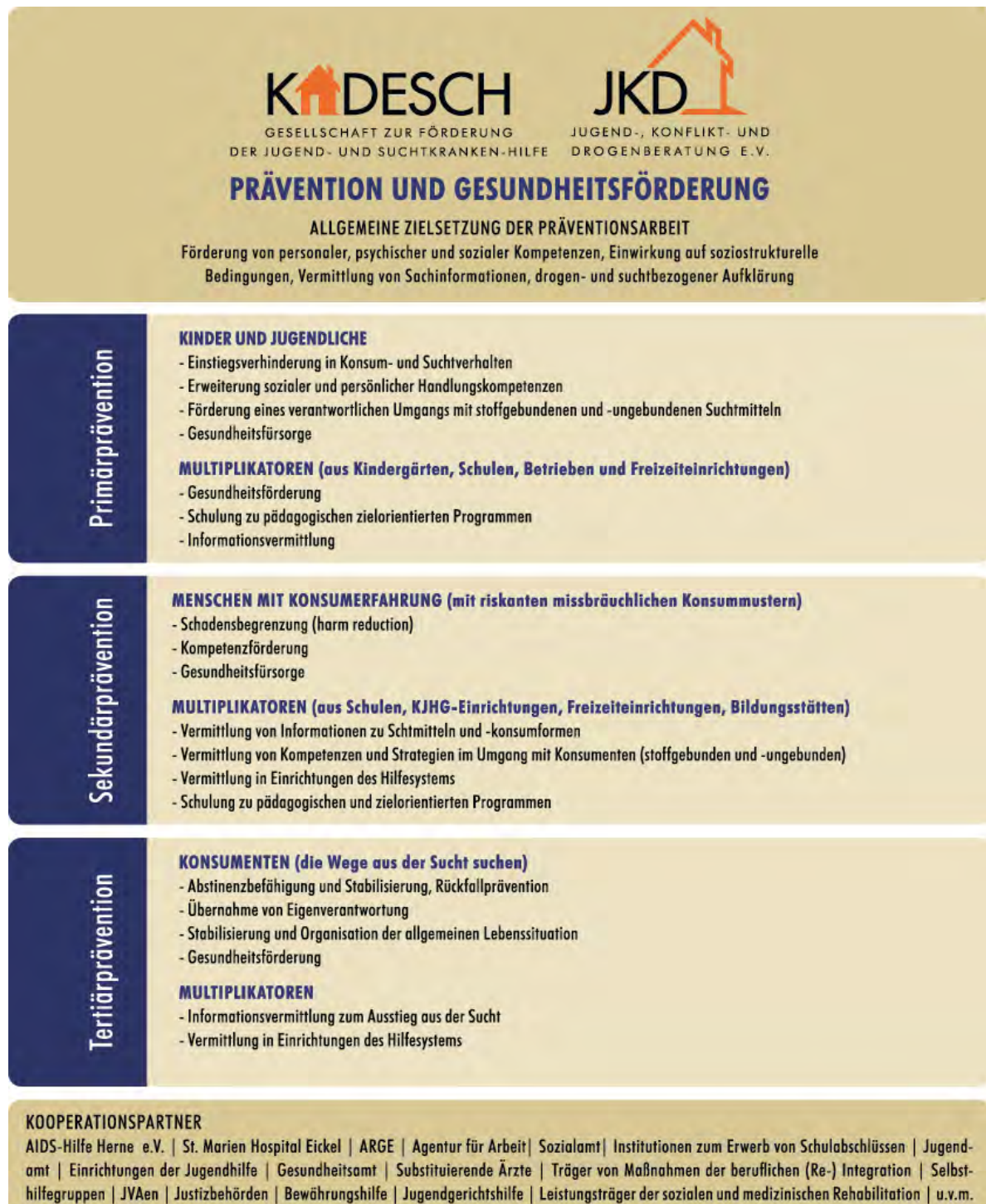
Schaubild: Prävention und Gesundheitsförderung der Fachstelle der JKD e.V. und Kadesch GmbH

Diese Grundgedanken setzen wir in unserer Präventionsarbeit um: